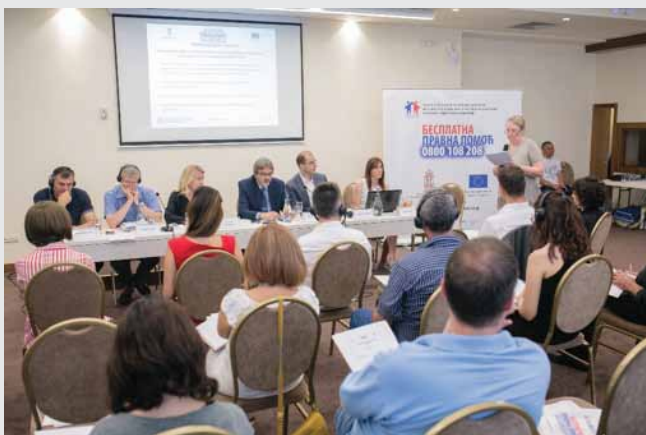
Презентација извештаја о преварним трансакцијама, јун 2017.

Тематски извештаји, који спадају у активности пројектног тима и спољних сарадника који се баве заштитом људских и својинских права интерно расељених лица са КиМ и генерално питањима приватне имовине на КиМ, редовно се разматрају на панел дискусијама које организују пројекат и Канцеларија за КиМ. О извештајима се дискутује у циљу бољег и систематичнијег сагледавања целокупног процеса заштите имовинских права интерно расељених лица, избеглица и повратника по реадмисији.