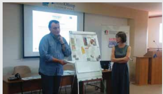
Тренинг правних саветника