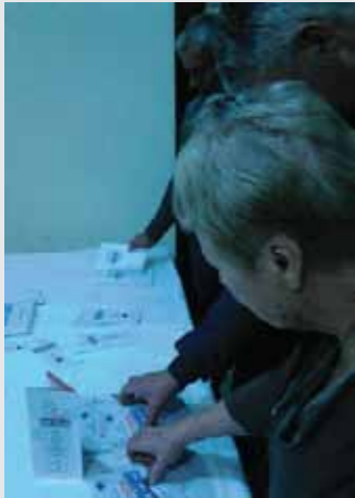
Промоција пројекта на редовном годишњем састанку повереника

У Кладову је од 6. до 8. новембра 2017. године одржан 13. радни састанак повереника за избеглице и миграције, у организацији Комесаријата за избеглице и миграције Републике Србије (КИРС) и уз подршку Банке за развој Савета Европе. Скупу је присуствовало више од 450 учесника међу којима су, поред повереника, били бројни гости из региона, представници међународних организација, институција, амбасада и Министарства за државну управу и локалну самоуправу.