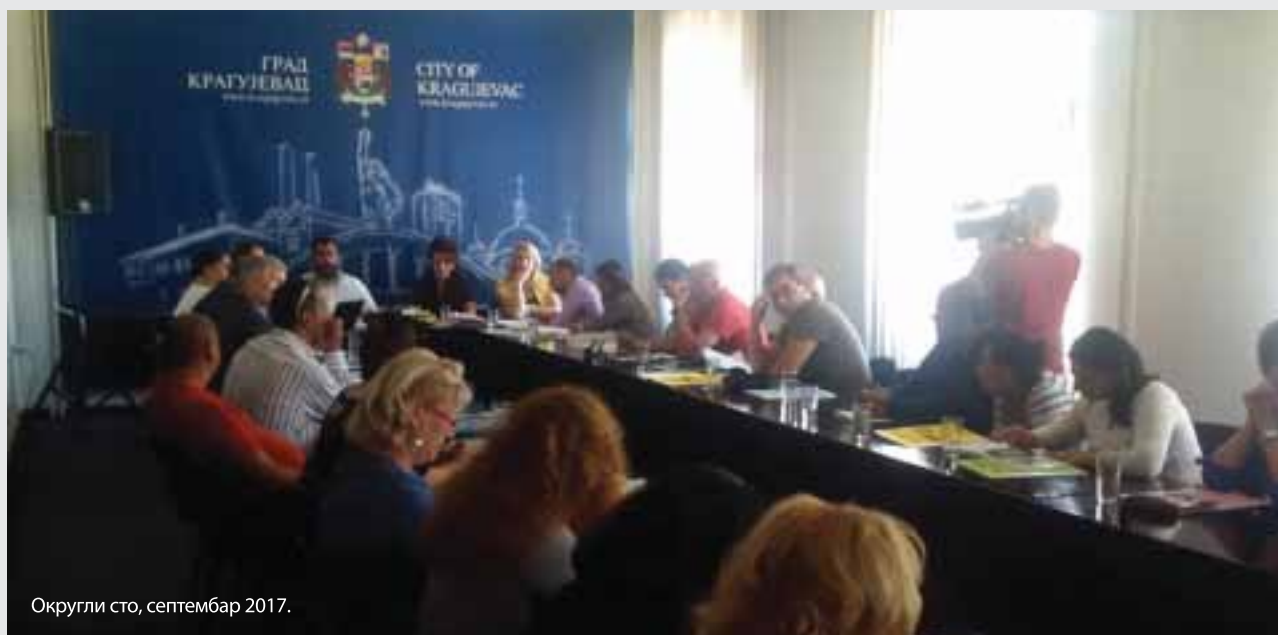
Округли сто, септембар 2017.

Правни саветници пројекта бесплатне правне помоћи, гостовали су 14. септембра 2017. године на округлом столу у Крагујевцу, у организацији пројекта „Социјално предузетништво код Ромкиња у Шумадијском и Поморавском округу“. Представљене су врсте помоћи које пројекат пружа угроженим групацијама, са посебним акцентом на помоћ повратницима на основу споразума о реадмисији и подељен је информативни материјал пројекта. Саветници су овом приликом остварили значајне контакте са удружењима која раде са повратницима на основу споразума о реадмисији. На лицу места су одржали и два састанка са потенцијалним странкама пројекта, попунили једну апликацију за пружање правне помоћи и прикупили документацију потребну за отварање предмета.