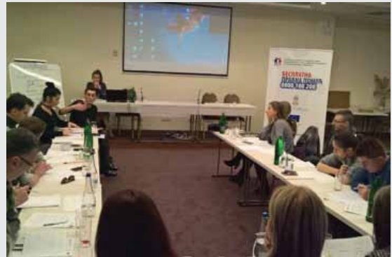
Редовне обуке приправника