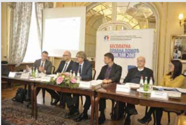
Панел дискусија, септембар 2017.

Њиховог расељавања, институционалне препреке у решавању ових случајева и значај укључивања међународних организација. У извештају су такође описани и конкретни случајеви бесправно заузете имовине Срба са КиМ, као и предлози за превазилажење препрека при решавању случајева преварних трансакција имовине.